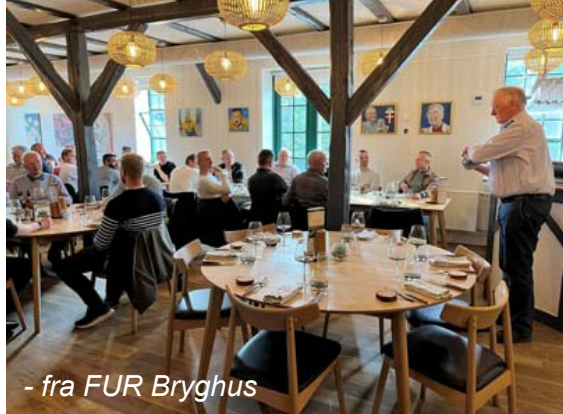
- fra FUR Bryghus

Vi holder et par pauser undervejs, og vi regner med at spise frokost (inkl.) på Fur Bryghus kl. 13.00.