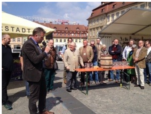
Et par glimt fra tidligere år på Øllets Dag på Torvet i Bamberg. Øverst åbner borgmesteren gildet og slår det første fad an. Neders en del af det forventningsfulde publikum. Måske er du med på billedet i 2024?