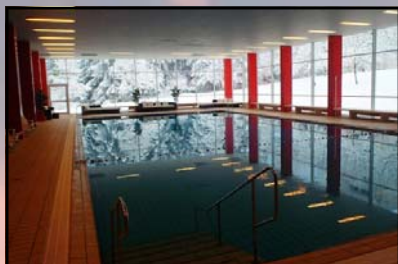
Bjerghotel bl.a. med swimmingpool