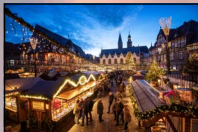
Julemarkeder bl.a. i Goslar