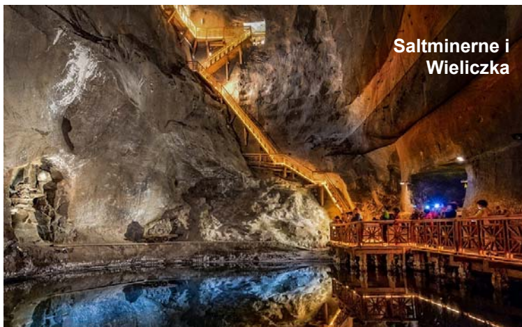
Saltminerne i Wieliczka