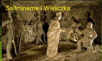
Saltminerne i Wieliczka