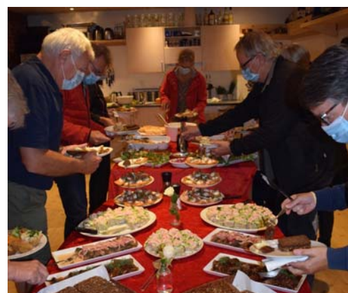
Herover: Glade (og lækkersultne) deltagere på en tidligere tur - i corona-perioden.....