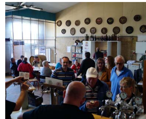
Herunder: Fra bryglaugets smagelokale